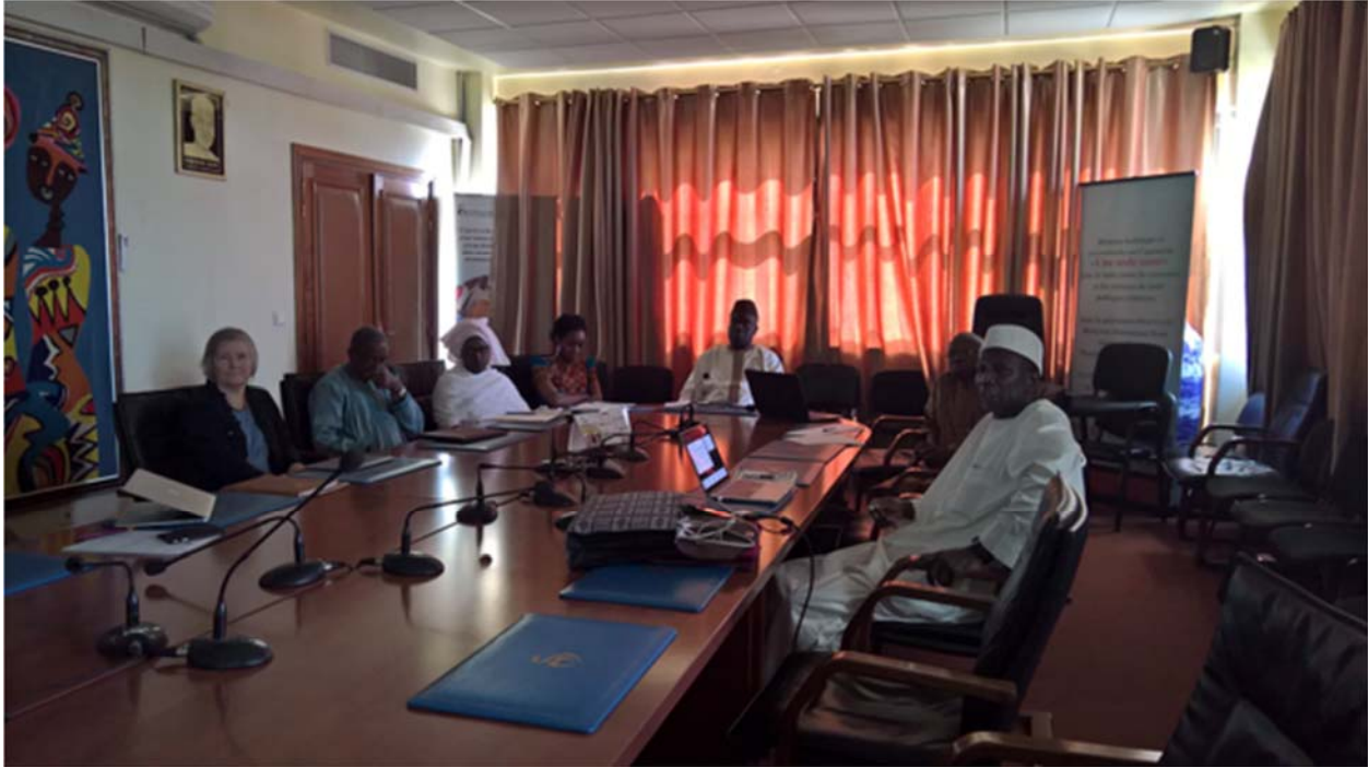
© Rencontre au Cabinet du MSAS

Après la présentation du projet de recherche et le point de mise en œuvre, les différentes autorités ont posé des questions de compréhension et formulé de suggestions pour mieux répondre au besoins du ministère. Il s'agit notamment de trouver un mécanisme durable pour la motivation des BG qui constitue actuellement une préoccupation.