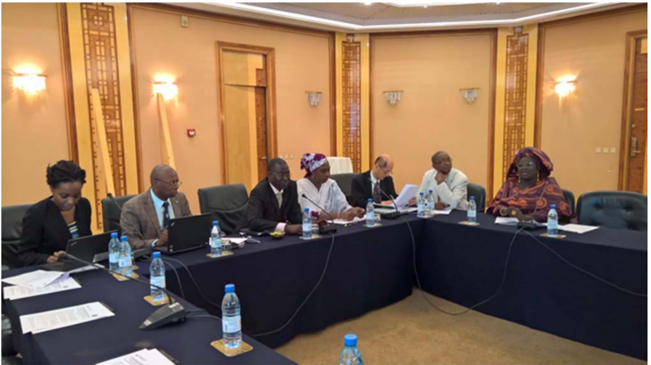
©Présidium lors de la cérémonie d'ouverture