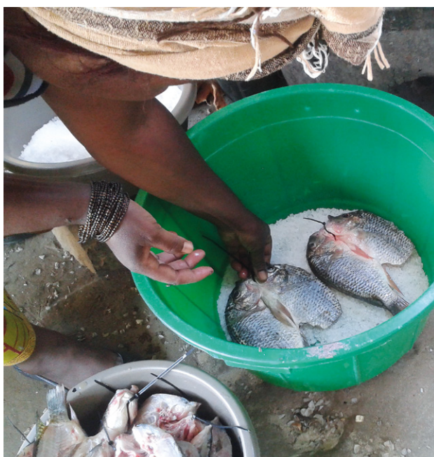
Femme séchant du poisson dans la plaine inondable de Barotse.

Les technologies améliorées de transformation du poisson ont aidé à réduire les longues heures de travail des femmes